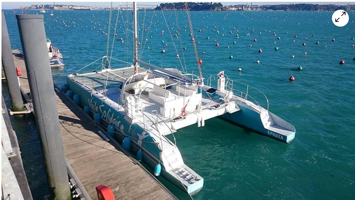
Le bateau Ephata. | ÉMERAUDE VOILE SOLIDAIRE

L'association Émeraude voile solidaire propose une balade tout public de deux heures à bord de son bateau Ephata.