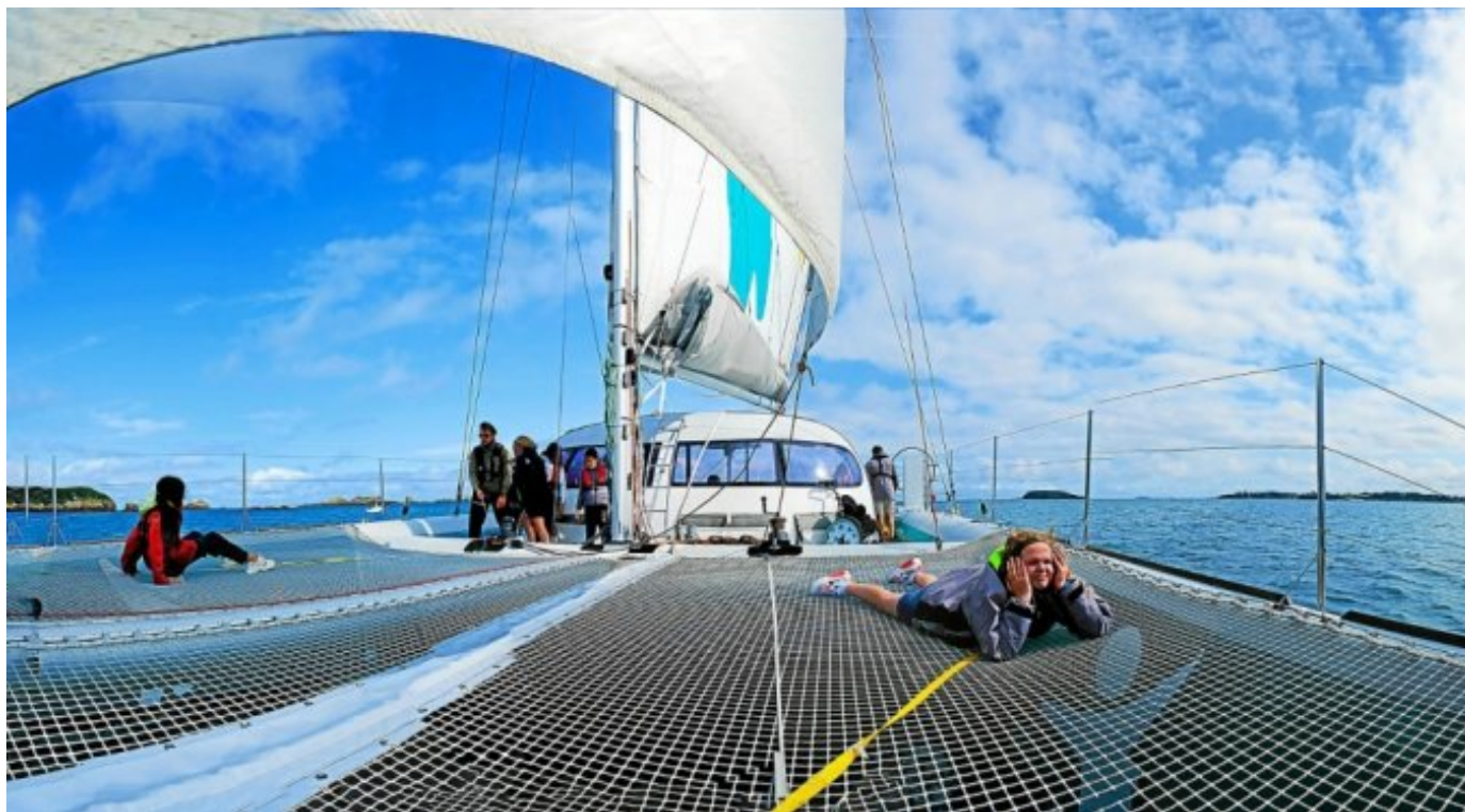
Depuis 2012, Émeraude Voile Solidaire a réalisé 660 sorties en mer pour 10 793 marins d'un jour. (Ephata)